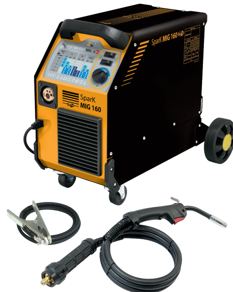
Поставляется с кабелем массы и Евро горелкой 2,2м.

Стабильная подача проволоки благодаря мощному подающему устройству на 40W.