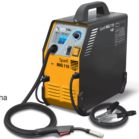
Entregado con cable de masa y antorcha fija 2,2m.