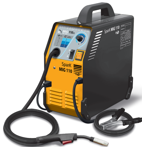
Livré avec câble de masse et torche fixe 2,2m.