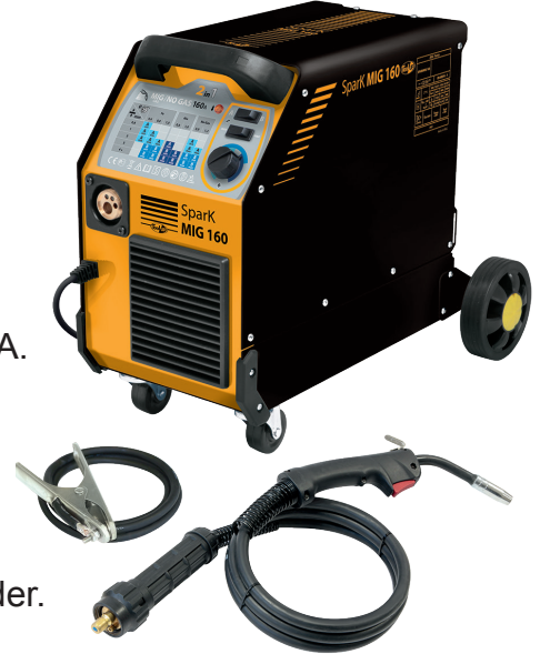
Geleverd met massakabel en demontabele toorts van 2,2m.

Constante lasdraadaanvoer dankzij een sterke 40W wire-feeder.