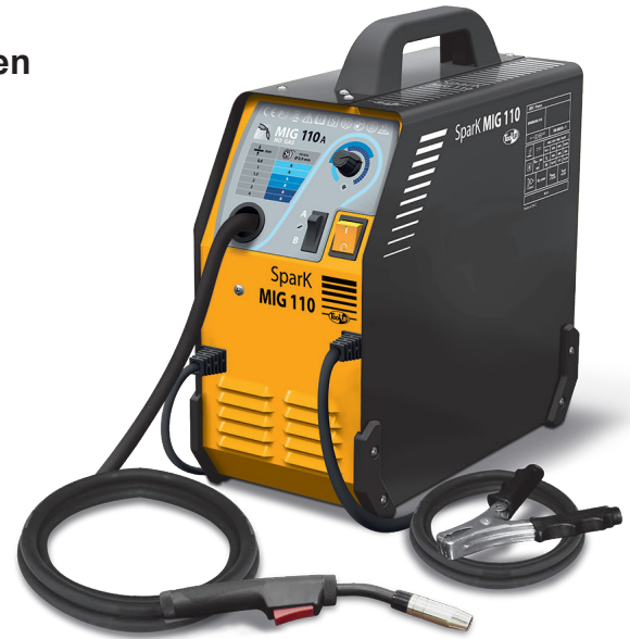
Geleverd met massakabel en vaste toorts 2,2m.