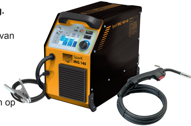
Geleverd met massakabel en vaste toorts van 2,2m.

Bescherming tegen oververhitting door een ingebouwde ventilator.